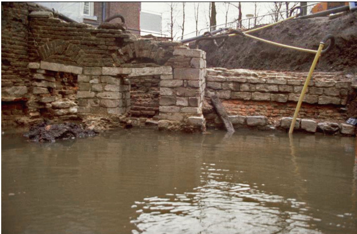
Aan vanuit het oosten op de opgegraven toren met rechtsonder het oudste fundament, nog bekleed met één rij Doornikse steen. De natuurstenen bekleding daarboven is uit een jongere fase. Links de zestiende-eeuwse storkoker.

Als we nu eens veronderstellen dat de afgebroken toren geen deel uitmaakte van een burcht maar fungeerde als verdedigings- of vluchtoren (en deel uitmaakte van de stadsmuur die vanaf 1332 werd aangelegd) zouden we meer grip kunnen krijgen op het stadsmuurtracé aan de noordwestzijde van de stad.