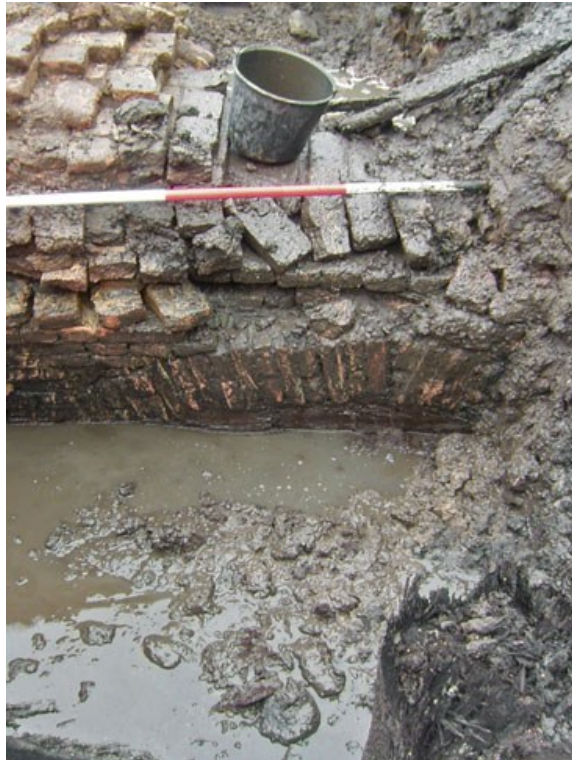
Spaarbogen in de fundering van de veronderstelde stadsmuur op het kasteelterrein (links) en aan de Markendaalseweg (rechts)