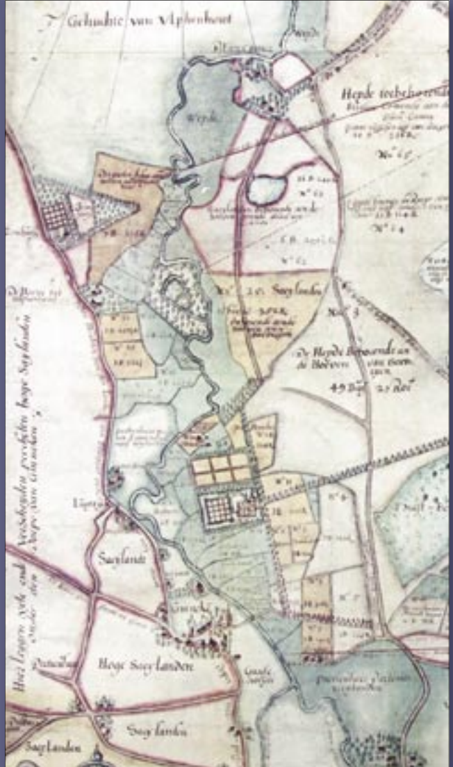
De kaart van het Mastbos en omgeving door J. Lips uit 1621, gekopieerd door J. Dou in 1625. Het zuiden is boven.

Ria Berkvens In het inrichtingsplan Bieberg, waarbij zo'n 40 hectare natuur in het Markdal werd ontwikkeld, zou de Oude Hof van Ulvenhout weer zichtbaar gemaakt worden door het uitgraven van grachten en het ophogen van twee eilanden. Teneinde inzicht te verkrijgen in de morfologie van dit verdwenen Oude Hof werd in het voorjaar van 2003 door de afdeling Archeologie van de gemeente Breda, in opdracht van de Dienst Landelijk Gebied Noord-Brabant, een archeologisch onderzoek uitgevoerd. Het onderzoek toonde aan dat het reconstrueren van de eilanden de goed geconserveerde grachten zou verstoren. Door het gedeeltelijk uitgraven van de oorspronkelijke grachten tot maximaal 0.35 meter en de twee aangetroffen eilanden op te hogen tot maximaal 1 meter zijn de aanwezige archeologische waarden in de bodem niet aangetast. Door het hoogteverschil en het verschil in vegetatie is de Oude Hof nu weer goed herkenbaar in het landschap.