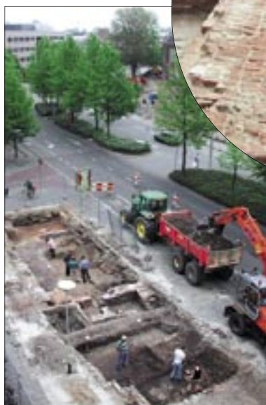
boven Aanleggen van het tweede vlak met de funderingen van de Gevangentoren.