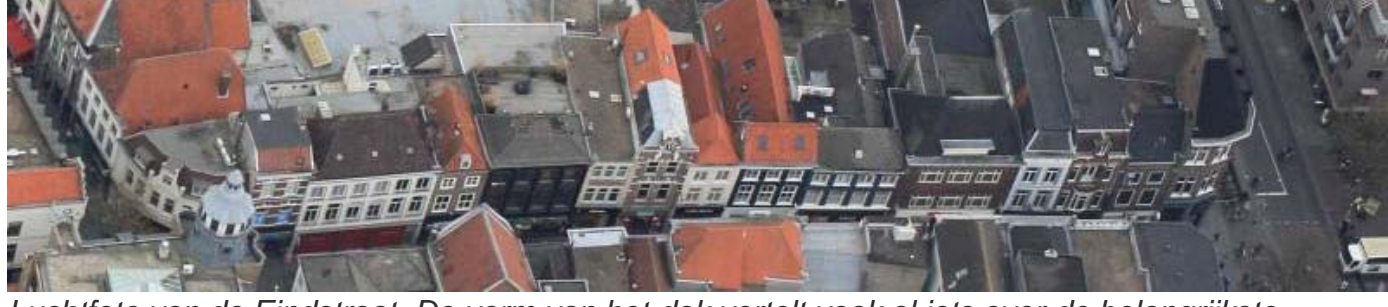
Luchtfoto van de Eindstraat. De vorm van het dak vertelt vaak al iets over de belangrijkste bouwfases van een pand. Ook ziet men hoe achterhuizen vastgroeiden aan het voorhuis.

Een gebouw met een uiterlijk uit het derde kwart van de negentiende eeuw heeft soms een vloerconstructie die niet bij de voorgevel past. Het kan gewapend beton van na de Tweede Wereldoorlog betreffen, maar ook een samengestelde balklaag met moer- en kinderbinten die, omdat we fijn eikenhout zien, in elk geval voor circa 1650 moet zijn aangebracht. Zat dat venster aan de rechterkant er trouwens niet raar in? Als je dan weer naar buiten loopt, snap je ineens de samenhang: hier was een poortje dat later binnen het huis is getrokken. Het individuele manifesteert zich bij een paar panden zeer sterk, omdat boven de horeca- of winkelruimte de tijd stil bleef staan. Er hangt wel eens een sfeer die aan een eigen 'vroeger' doet denken: de Wees Wijs met Water-sticker uit 1980 op de badkamerspiegel. Een andere woning bleek bevroren in zijn toestand van 1885. In de achterkamers was nog één keer behangen: onder het behang zit een Maasbode geplakt uit oktober 1919.