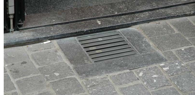
'Moet u ook boven zijn? Heel graag!' Daar kan zomaar een heel oude kapconstructie zichtbaar zijn. Een dergelijk, weinig spectaculair rooster voedt de hoop dat er een middeleeuwse kelder is.