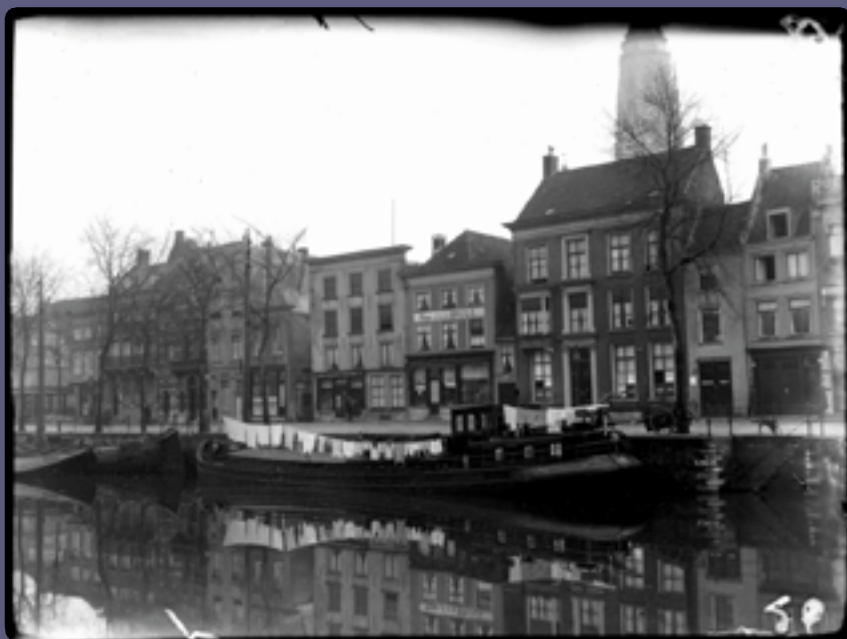
Zicht op het bouwblok tussen Haven en Visserstraat gezien van de overzijde van de Haven, circa 1920