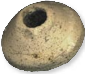
boven Spinsteentje, gebruikt voor het spinnen van de wol, Andenne aarderwerk, 12 e eeuw.