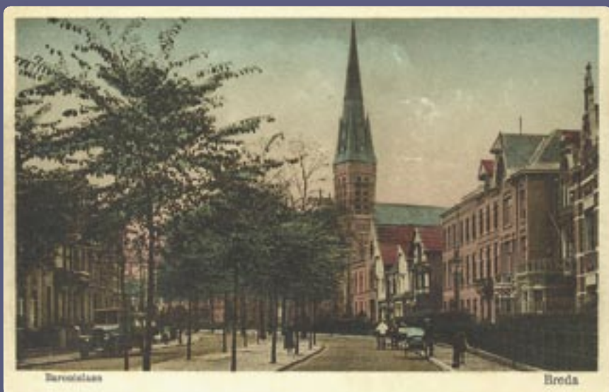
links Het landhuis Burgst.