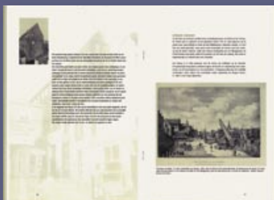
De brochure Een bijzonder stukje Bredase binnenstad is op verzoek nog verkrijgbaar.