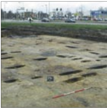
boven Breda, Adriaan Klaassenstraat, gebouw 1 richting Ettensebaan. De sporen van de huisplattegrond na het couperen. onder Aanzicht vanuit het park Valkenberg van de 16 e -eeuwse kademuur en de voorliggende moderne klampmuur. Op de achtergrond is de rest van een gewelfdoorgang zichtbaar.