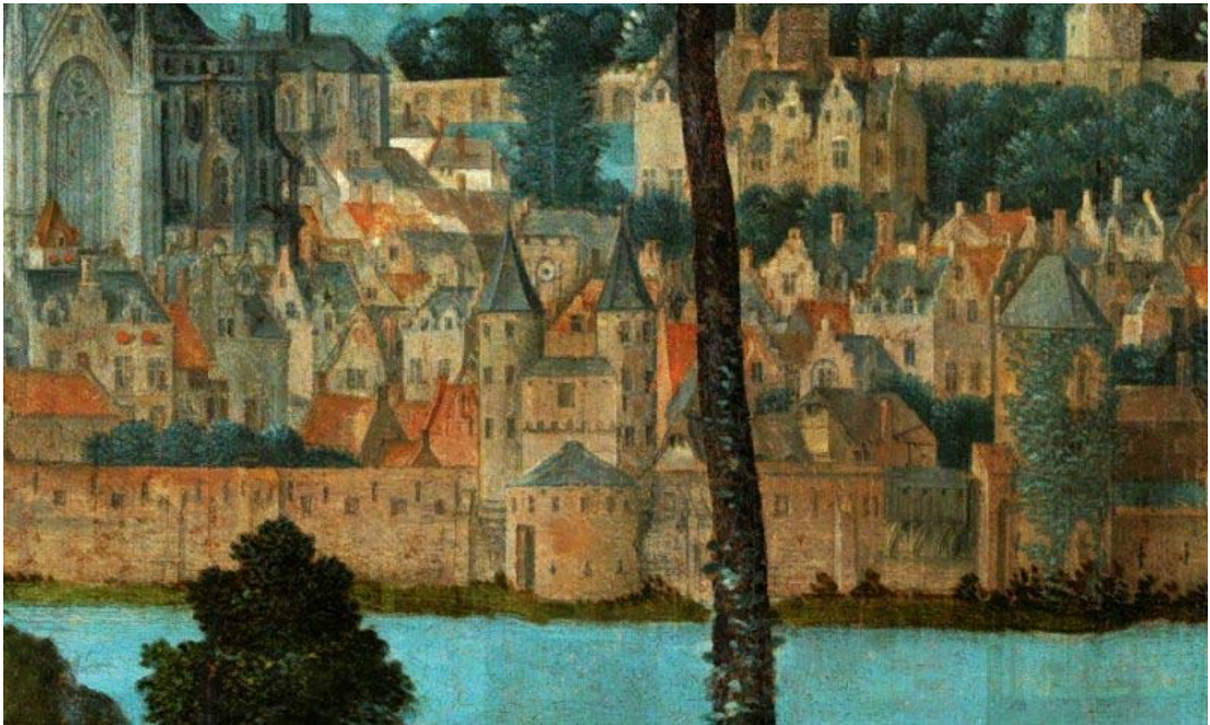
afb.2) Een detail uit het bovengenoemde paneel met centraal de Waterpoort met het in 1517 aangelegde rondeel vóór de toegang

Deze middeleeuwse poort is een van de meest raadselachtige structuren in de middeleeuwse vesting. Allereerst door de functie van deze poort. Geen versterkte poort over het water heen, zoals in Delft en Amersfoort maar een versterkte toegang tot de Mark, dus met laad- en losmogelijkheden. (waar de archiefbronnen overigens verder over zwijgen.)