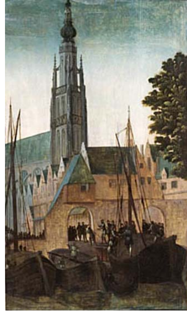
afb.3 en 4) De Waterpoort aan de Vismarkt gezien vanaf de stadzijde en waterzijde. De poorten bevinden zich in de stadsmuur. De afbraak van hiervan begint een jaar later, in 1536. Vanaf de waterzijde zijn voor de poort nog vagelijk traptreden zichtbaar.