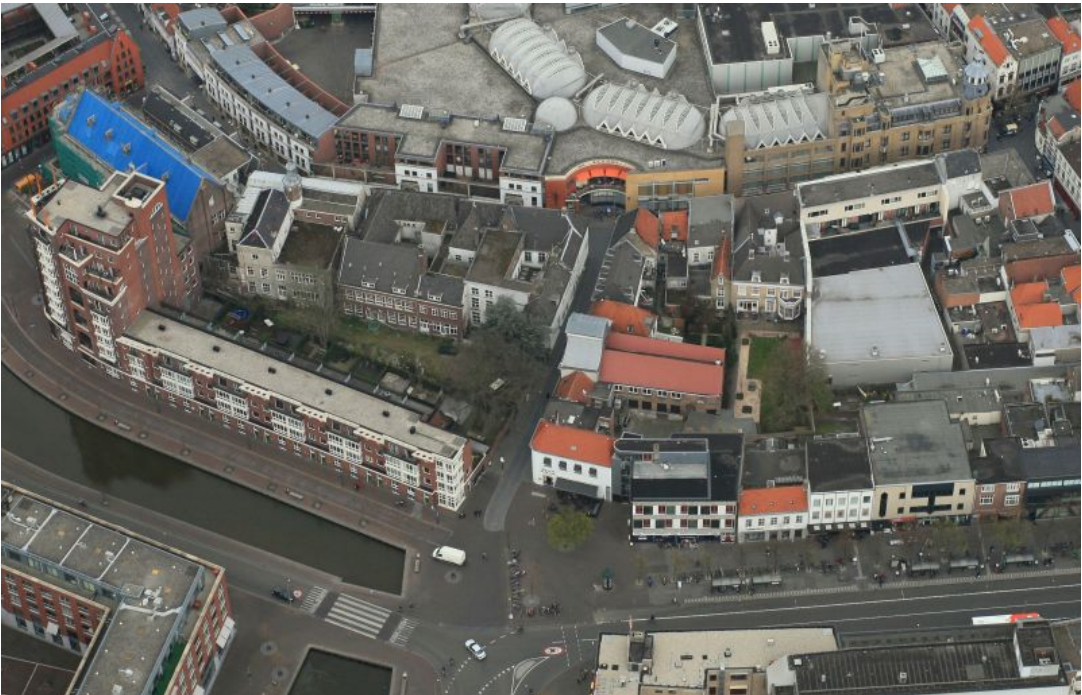
afb. 1) Luchtfoto met centraal van zuid naar noord de Waterstraat en haaks daarop de Nieuwstraat. Op de voorgrond het voormalige tracé van de Mark en de stadsgracht, nu de Markendaalseweg en de Karnemelkstraat.

Van een aantal straten in Breda is de oorsprong en naamgeving op z'n minst onduidelijk of verwarrend. In een vorig artikel zijn de Cingelstraat en het Kasteelplein belicht. 1 Ditmaal nemen we de Waterstraat en een deel van de Nieuwstraat onder de loep. 2 Deze twee straten hebben namelijk oudere afwijkende namen, namelijk Waterpoortstraat en Steenbrugstraat, die ook nog door elkaar gebruikt werden. Daarbij komt nog dat de Nieuwstraat voorbij de knik bij het toekomstige hotel (Nieuwstraat 21-29) niet meetelt in dit verhaal. Dat is werkelijk een "Nieuwstraat".