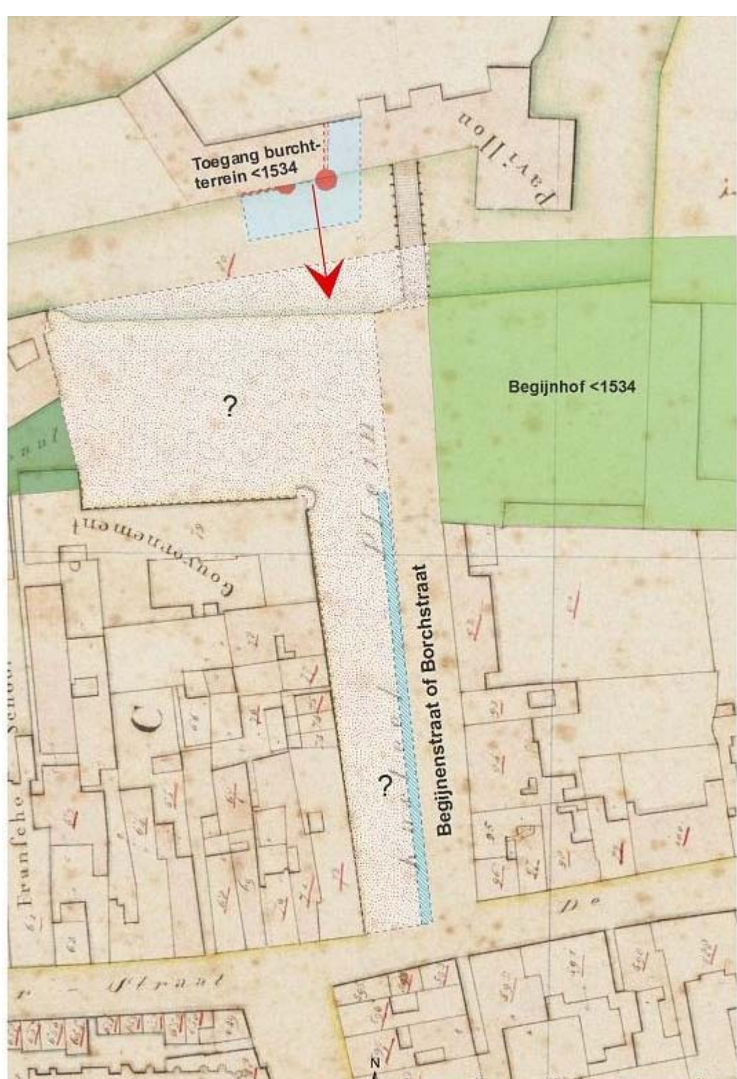
Het Kasteelplein op het kadastraal minuutplan uit 1824 met daarop het lastig te interpreteren deel.

Nog ingewikkelder wordt de veertiende eeuwse situatie waarbij kasteeltoegang helemaal niet meer lijkt met het Kasteelplein (zie betoog Cingelstraat), de Begijnenstraat gewoon aantoonbaar is en de breedte nog steeds lijkt overeen te komen met die van huidige Kasteelplein. Een breedte die we alleen van marktpleinen kennen. Zijn we hier een huizenblok kwijt?