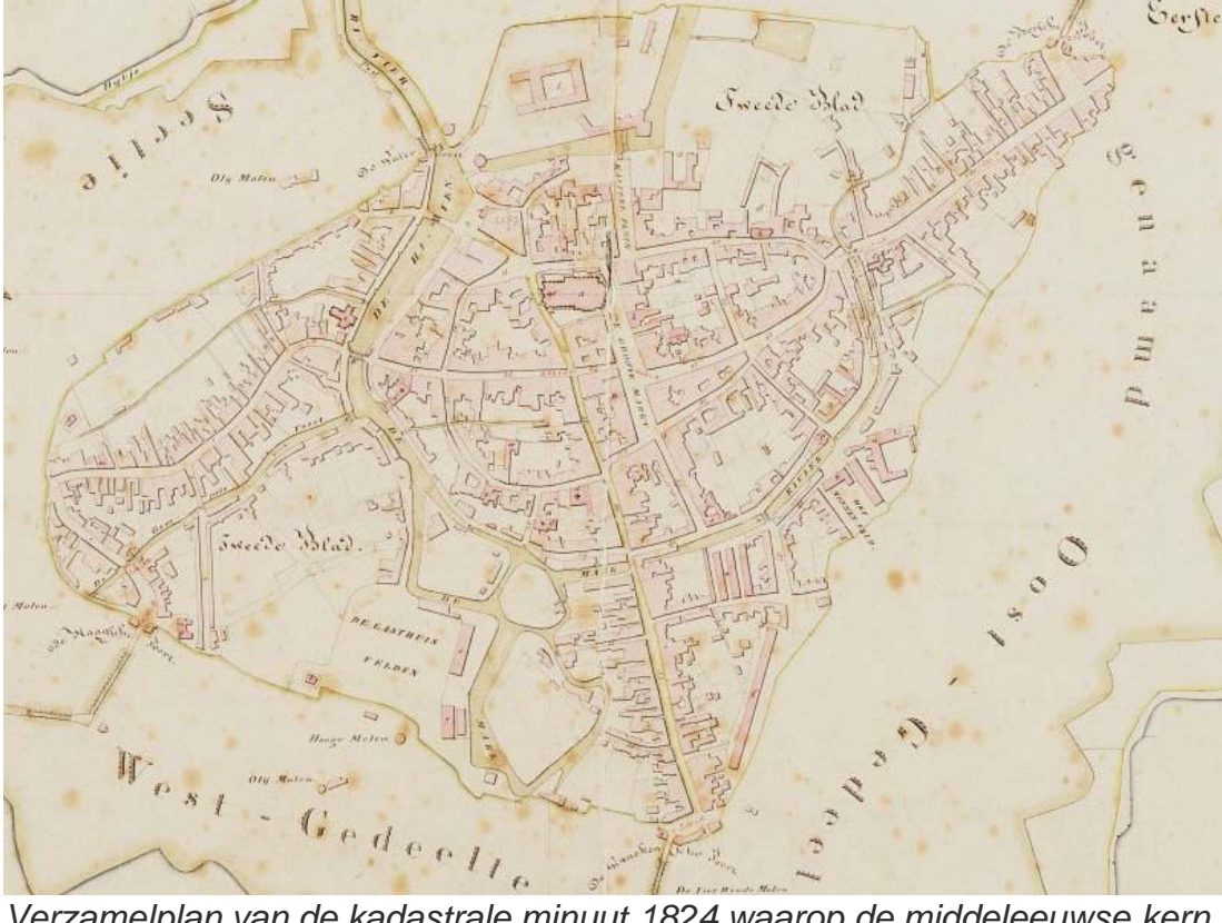
Verzamelplan van de kadastrale minuut 1824 waarop de middeleeuwse kern met de drie "einden" goed zichtbaar is

Bij het vervaardigen van een kaart van de middeleeuwse (vijftiende eeuwse) stad zijn er toch nog onduidelijkheden over het ontstaan, status en begrenzing van bijvoorbeeld de Cingelstraat en het Kasteelplein.