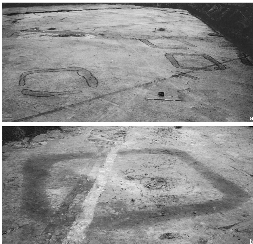
Afb. 7.5 Vierhoekige grafmonumenten op Steenakker, met (a) en zonder opening (b). Links op foto a bevindt zich Graf 28, rechts ervan vooraan Graf 26, direct erachter Graf 25. Langs de putwand is nog een deel zichtbaar van Graf 24. Foto b toont Graf 22.

Het merendeel van de grafmonumenten had een opening in de greppel, meestal in de zuid-, zuidoost- of oostzijde van de randstructuur (zie afb. 7.5a). Bij slechts