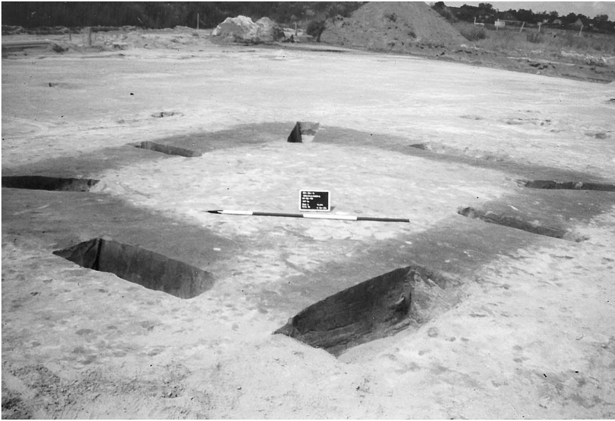
Afb. 7.11 Graf 43 op Steenakker

die tezamen met resten van voedsel in een urn is aangetroffen. Van de overige graven zijn alleen de greppels bewaard gebleven.