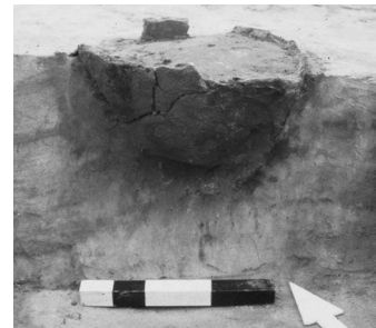
Afb. 7.6 Graf 56 op Huifakker

Een opmerkelijke vondst in het grafveld van Steenakker is een vierkante kuil waarin aan één zijde vier complete potten waren geplaatst (Graf 52, zie afb. 7.7). Aangezien het overgrote deel van de kuil opvallend leeg was, is het mogelijk dat we te maken hebben met een inhumatiegraf. Er was echter geen lijksilhouet zichtbaar. Aanwijzingen voor een heuvel boven het graf ontbreken zodat onduidelijk is