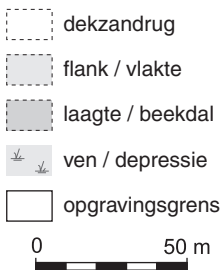
Afb. 7.1 Grafmonumenten op Emerakker

Voor iedere dode werd een nieuwe brandstapel gebouwd. Vaak werden op de brandstapel ook allerlei goederen mee verbrand. Restanten hiervan werden ver-