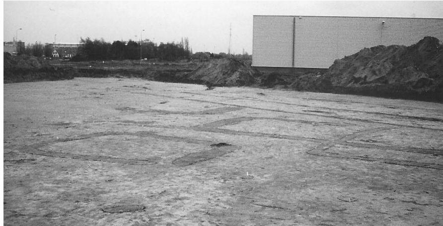
Afb. 7.9 Graven 31, 32 en 33 op Steenakker

scheidenheid. Zone I ligt vrij geïsoleerd vanwege de begrenzing door depressies aan de west-, zuid- en oostzijde. In deze langgerekte zone liggen de meeste grafstructuren. Ze zijn merendeels rechthoekig met een opening in het zuidoosten. De graven oversnijden elkaar niet, alleen rond Graven 31 tot en met 33 lijkt vermenging te hebben plaatsgevonden (zie afb. 7.9). Grafmonumenten van bovennormale omvang ontbreken. Vermoedelijk zijn de kringgreppels de oudste graven, en zijn ze opgevolgd door de rechthoekige greppelstructuren en vlakgraven. Hoe de graven zich in de loop der tijd verspreid hebben, is niet goed duidelijk. In zones II en III liggen de grafstructuren allemaal geïsoleerd of paargewijs bij elkaar. Het gebied is vrij uitgestrekt en er lijkt dan ook eerder sprake te zijn van een aantal losse grafmonumenten dan van een grafveld. Rechthoekige structuren ontbreken; kringgreppels en vlakgraven overheersen. De kringgreppels in zone II liggen naast elkaar, aan de rand van een depressie, en vormen mogelijk de eerste grafheuvels op Steenakker. De graven in zones II en III zijn met hun verschillende grafmonumenten en geïsoleerde ligging duidelijk ouder dan het gestructureerde en vrij aaneengesloten grafveld in zone I.