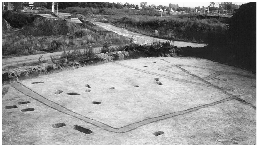
Afb. 7.8 Graven 57 en 58 op Huifakker

De graven op Huifakker (zie afb. 7.2) bestaan eveneens uit een mogelijk geïsoleerd gelegen vlakgraf (Graf 56) en een cluster van drie rechthoekige grafgreppels. Van Graf 56 (afb. 7.6) is op grond van het ontbreken van een crematie, niet zeker of het daadwerkelijk een grafkuil betreft. In de 0,32 m diepe kuil was wel een zogenaamde Harpstedt -urn geplaast. Het cluster van de andere graven (zie afb. 7.8) ligt aan de oostkant van de dekzandrug en wordt gevormd door een rechthoekig graf van 18 x 13 m (Graf 57) en twee kleine rechthoekige graven