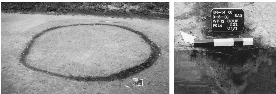
Afb. 7.4 Graf 54, met een doorsnede door de kringgreppel.

De opvulling van twee kringgreppels, Graven 54 en 55, is gedetailleerd bestudeerd. Deze sporen lagen op leemrijk dekzand niet ver van een fossiele waterloop. Op het vlak is goed te zien dat de oostzijde, die grenst aan de oude waterloop, lager ligt. Dat de greppels zijn gegraven in een hellend landschap, blijkt ook uit de geringere diepte van het zuidelijke en westelijke deel van de sporen. De bodemopbouw langs de waterloop onderscheidt zich door een zwarte laag, ontstaan uit niet verteerde plantenresten. 6 Dergelijke lagen krijgen tegenwoordig geen kans zich te ontwikkelen, doordat ten gevolge van bemesting en doorluch-