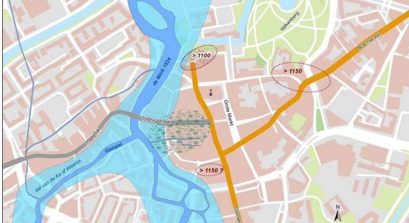
De oudste bewoningkern aan de noordwestzijde van de stad met in geel mogelijke onsluitingswegen

Leenders verbreedt de verklaring nog door zich de vraag te stellen welke plaats het meest geschikt was voor de stichting van 'kerk, hof en kasteel'. Hij stelt zich een hoogte voor in het noordwestelijke gedeelte van de stadskern. De argumentatie is dat de dekzandkop waarop de oudste kern ligt, de meest zuidelijke is waar oost-west verkeer slechts met één rivierovergang te maken had 4 . Daartoe werd de Haagdijk in het begin van de 13e eeuw aangelegd om het dal van de Mark gemakkelijk te kunnen kruisen 5 . In de periode tussen 1983 en 1997 heeft er veel archeologisch onderzoek plaatsgevonden in de nabijheid van de Mark. Met die resultaten in het achterhoofd zijn bij de "brede Aa" een aantal bondige kanttelingen te maken.