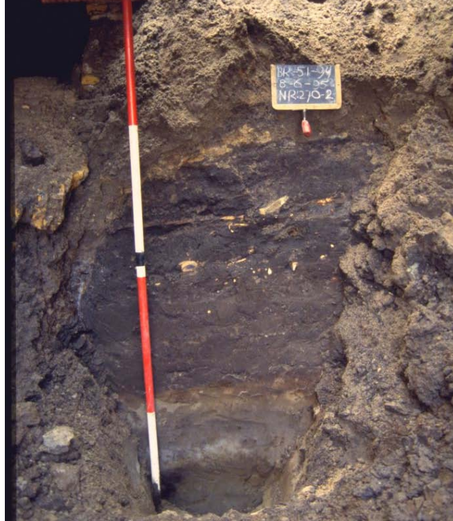
Het gereconstrueerde Markdal met gerelateerd archeologisch onderzoek uit de periode 1984-2007 (links). Daarnaast veen met houtresten in de ondergrond van de Lange Brugstraat.