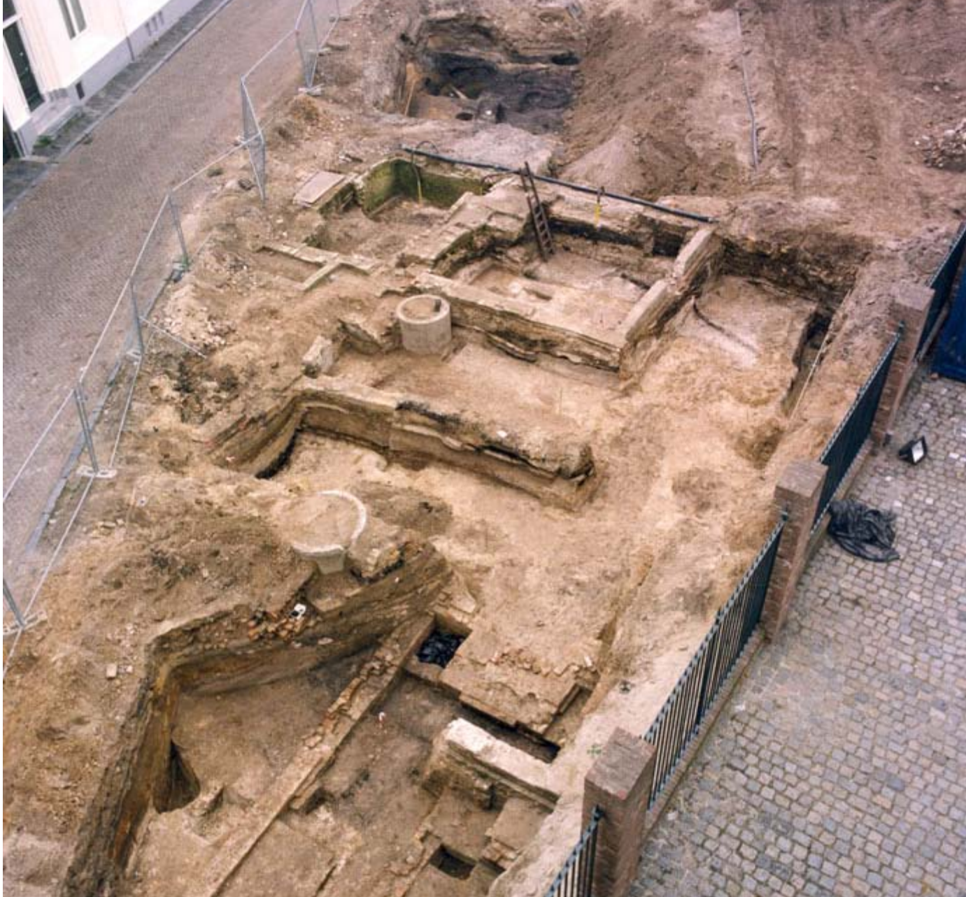
Onderzoek Kraanstraat 1997 met zicht op de oudste, 12e eeuwse bewoningsslagen onder de middeleeuwse bebouwing.

In het hierboven geschetste model voor de vroegste bewoningperiode past geen tolheffing door de Heren van Breda ter hoogte van de Tolbrug 10 . Immers deze landweg-waterweg kruising wordt aan de hand van de archeologische sporen in de 2e helft van de 13e eeuw geplaatst. Aannemelijker lijkt dat hier goederen werden overgeslagen van water naar land. Het is immers maar de vraag hoe ver en of de Mark ten zuiden van de nederzetting bevaarbaar was en hoeverre er een achterland was dat bediend moest worden via het water.