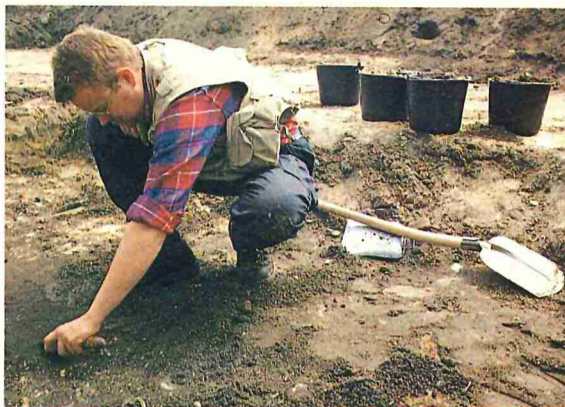
Opgraving op het terrein van MAB/V&D aan de Nieuwstraat.