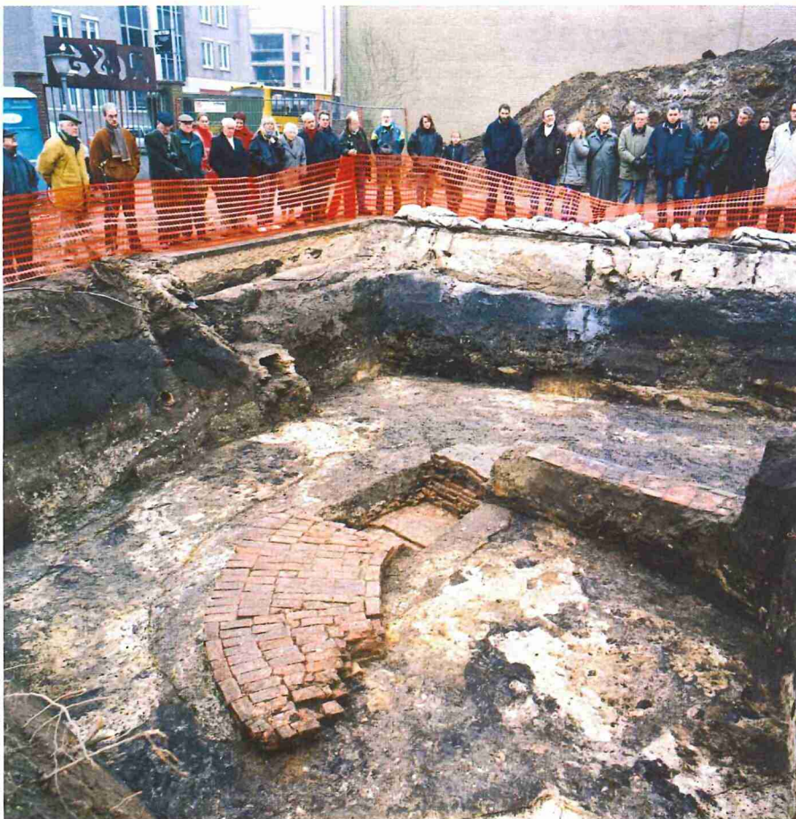
De opgravingswerkzaamheden in de binnenstad van Breda trokken veel belangstelling

bronnen zoals archieven. Een recent voorbeeld uit Breda kan dit illustreren.