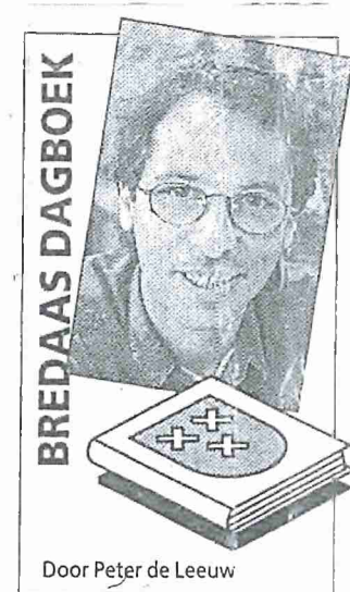
Door Peter de Leeuw

Het huis is in 1525 gekocht door Godevaert van Brecht, die er zijn naam dus blijvend aan verbond. In zijn opdracht is het pand verbouwd en kreeg het onder meer een fraaie galerij. „Het moet er toen voornaam en zeer mooi hebben uitgezien. In de eeuwen daarna zou het aftakelen tot een bijna onherkenbaar huis...“ schrijft Eric Dolné. Momenteel zijn de zuilen van de galerij weer duidelijk in de buitenmuur aan de Kraanstraat te onderscheiden. In 1792 wordt het huis aan de Cingelstraat voorzien van een