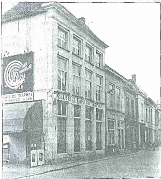
• De Trapkes in 1962, kastelein Geuze-Goos tapt uiter- aard 3-Hoefijzersbier. - - FOTO RIJKSDIENST V / D MONUMENTENZORG ZEIST