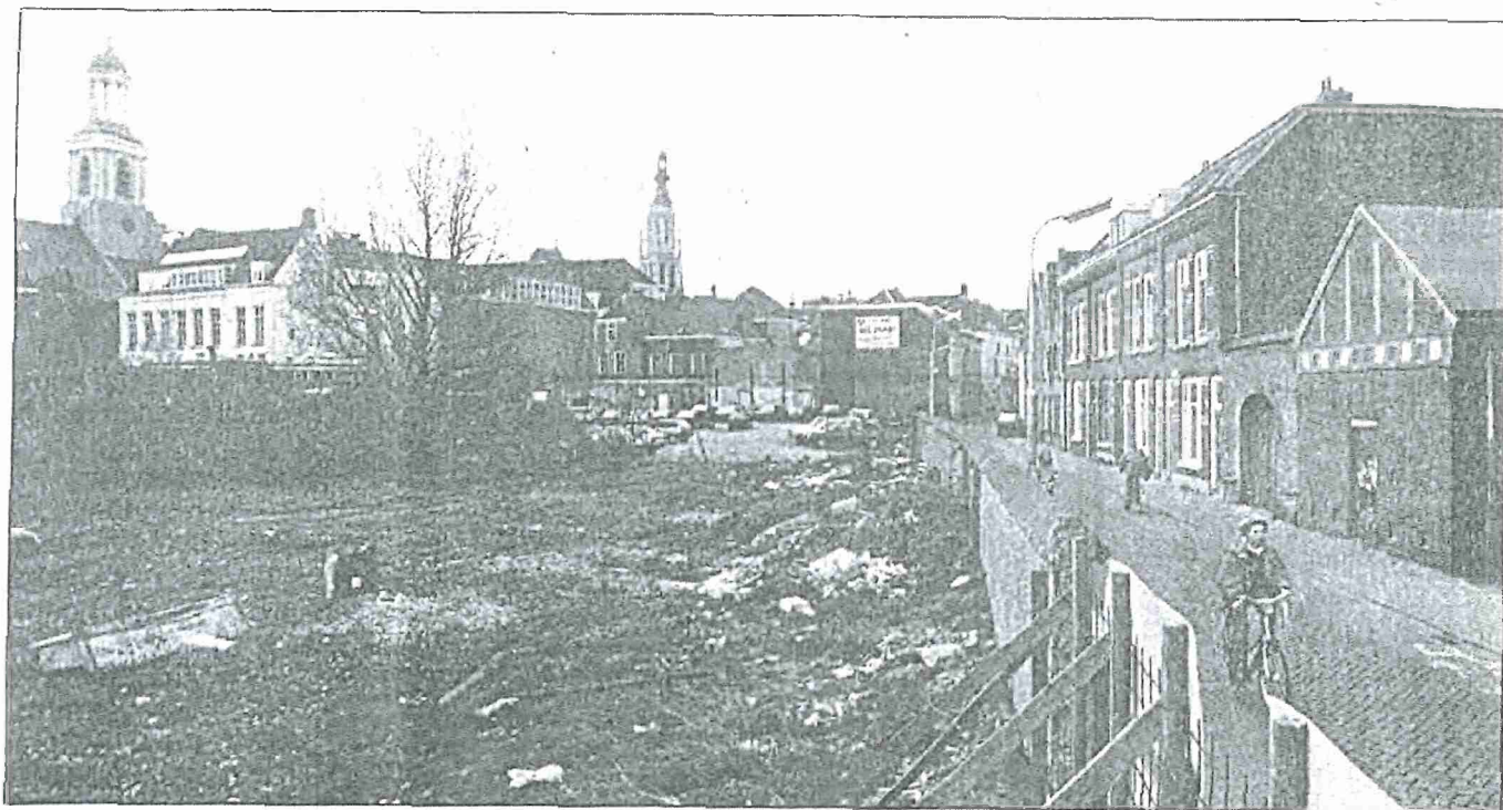
• De Molenstraat anno 1990 -