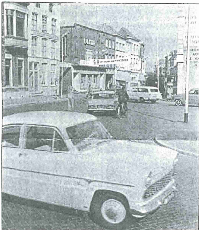
• De Boschstraat met rechts nog een streepje van de Beyerd en de Vlaszak, voordat (links) de grote doorbraak tot stand kwam. Foto dateert uit 1962.