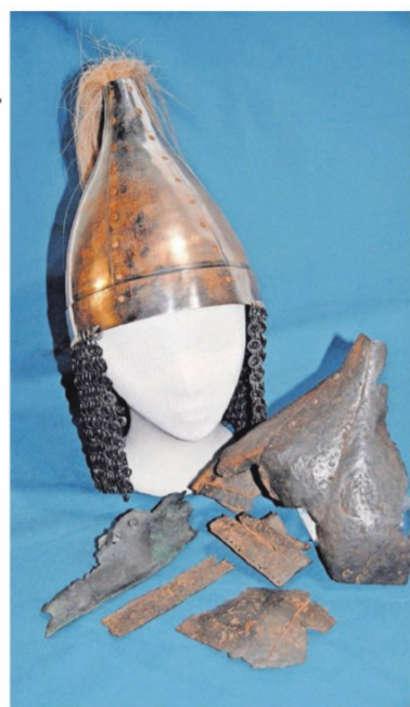
▲ Restanten van een Romeinse helm.