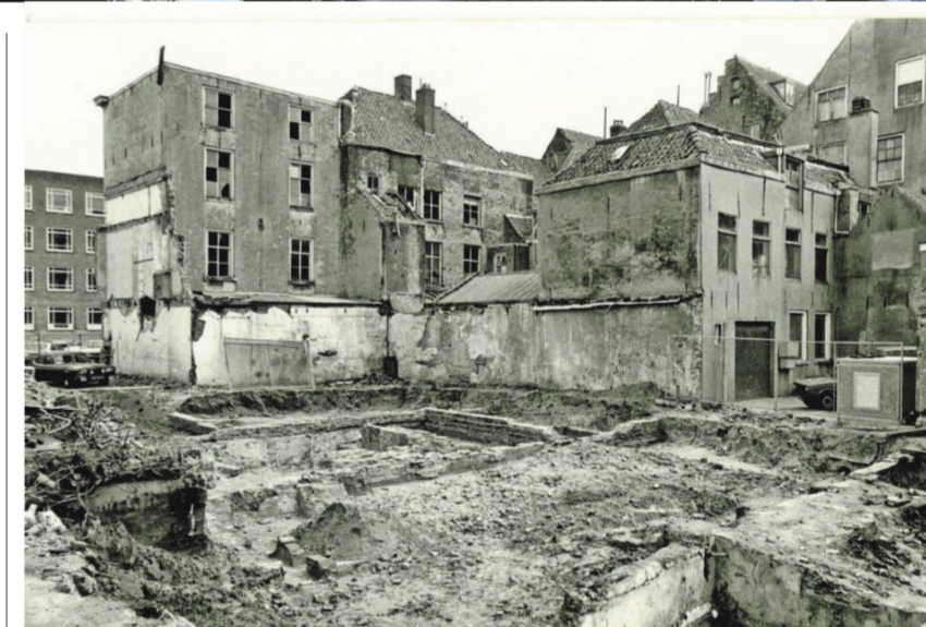
▲ Opgraving in 1983 aan het Kasteelplein bij de vroegere drukkerij van Dagblad De Stem.

▼ Deze pot werd gevonden in de buurt van de huidige Baronesgarage.